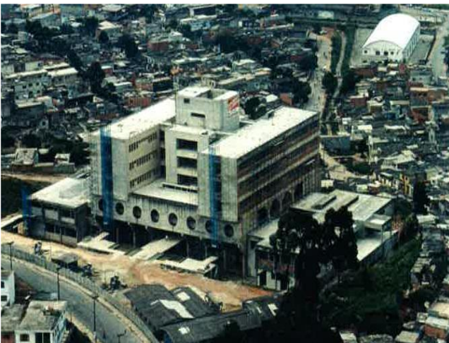
Obras – 1997

Vinculado a Secretaria Estadual da Saúde, o hospital é gerenciado desde então pela Associação Paulista para o Desenvolvimento da Medicina (SPDM), através do modelo OSS - Organizações Sociais de Saúde, criado através da Lei das OSS nº 846 055/1998.